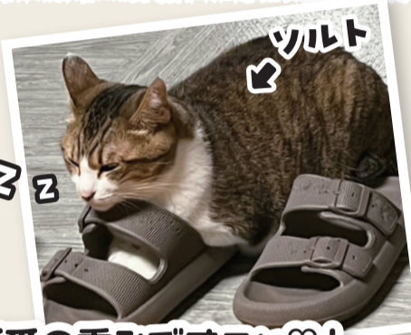
スリッパ「えっ…重いんだけど。」 ソルト(ネコ)「愛の重みですニヤ♡」

子猫のころ、スリッパは私の秘密基地だった。暖かくて丁度いい狭さでぴったりサイズ。でも今は……大人になっちゃって、もう入れない。だから最近はこうして、くっついて寝るんだ。