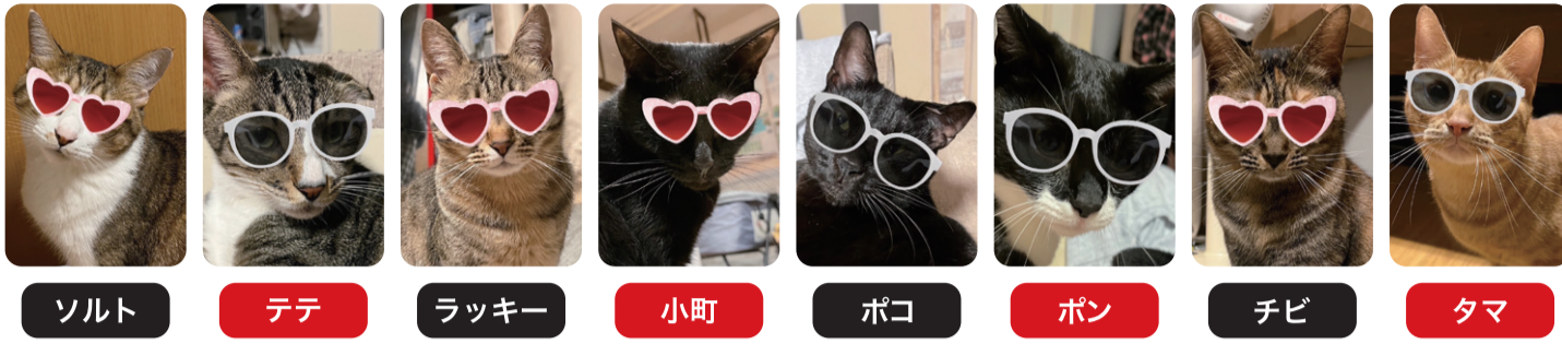
ソルト テテ ラッキー 小町 ポコ ポン チビ タマ