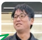
まつなが 洗車が好き。