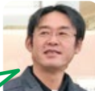
もとなが 焼飯作りが好き。