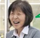
はらだ 旅行が好き。

孫にご飯が美味しいと言われた時。ご近所さんの新鮮なお魚とお野菜のおかげです。(感謝)