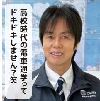
高校時代の電車通学ってドキドキしません?笑