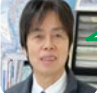
おきた お祭りが好き。