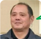
すえどみ 野球観戦が好き。