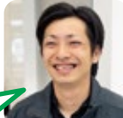
よこや ゴルフが好き。

小学生低学年の頃の通知表は常にアヒルさんの大群でしたが高学年になるにつれ少しずつ居なくなり褒められた事を思い出します。