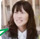
ほり スイーツが好き。

孫にご飯が美味しいと言われた時。ご近所さんの新鮮なお魚とお野菜のおかげです。(感謝)