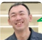
むらなか カラオケが好き。