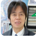
おきた お祭りが好き。