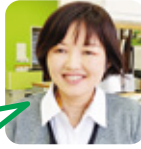
すずうら ライブ・映画が好き。