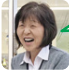
はらだ 旅行が好き。

ピアノ。寂しい置物になっていたのを孫たちが楽しそうに弾くので、再挑戦してみようかなと思います。