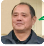
すえどみ 野球観戦が好き。