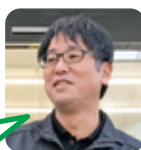
まつなが 洗車が好き。