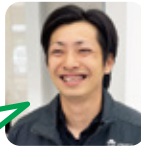
よこや ゴルフが好き。