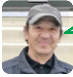
しのはら 魚釣りが好き。