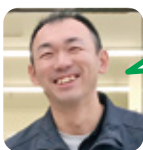
むらなか カラオケが好き。

テーマ 4月から新店舗はぎ阿武店がオープン!そこであなたが春から始めようとしていることは?