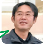
もとなが 焼飯作りが好き。