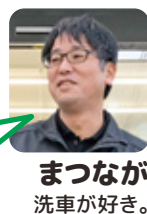
まつなが 洗車が好き。