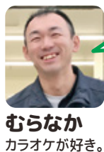
むらなか カラオケが好き。