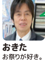
おきた お祭りが好き。

卒業式の翌朝、あれほど行くのが面倒だと思っていた学校が恋しくなった。今となれば高校は10年位あってもいいくらい。