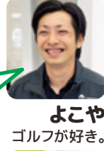
よこや ゴルフが好き。