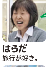
はらだ 旅行が好き。

ユーミンの「アニバーサリー」を聞くと、子供の卒業式でながれたスライドを思い出します。涙と笑いでした。