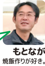
もとなが 焼飯作りが好き。