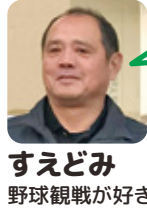
すえどみ 野球観戦が好き。