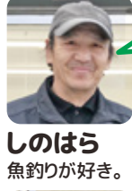
しのはら 魚釣りが好き。

高校卒業後すぐに就職内定先より赴任の案内が有り慌てて準備をし出発しましたが、行ってみれば自分と合わせてたった二人だった。