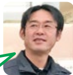
もとなが 焼飯作りが好き。