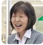
はらだ 旅行が好き。

A. 予定を立てない旅行と片付けですが、何もなく終わりそう。 B. 毎年恒例!孫と粉(もみ)まき