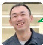
むらなか カラオケが好き。