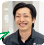
よこや ゴルフが好き。

A. オモウマイ店巡りをしたい。 B. 愛知に居た時、連休を利用してドライブをしていました。