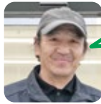
しのはら 魚釣りが好き。

A. オモウマイ店巡りをしたい。 B. 愛知に居た時、連休を利用してドライブをしていました。