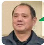
すえどみ 野球観戦が好き。

A. 休むと仕事たまるので仕事してるかも。 B. ゴールデンウィーク。TVで渋滞情報見ます。