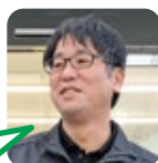
まつなが 洗車が好き。

A. 休むと仕事たまるので仕事してるかも。 B. ゴールデンウィーク。TVで渋滞情報見ます。