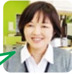
すぎうら ライブ・映画が好き。

A. 予定を立てない旅行と片付けですが、何もなく終わりそう。 B. 毎年恒例!孫と粉(もみ)まき