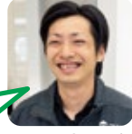
よこや 浅田小・三隅中卒

A. エレファントカシマ シ「今宵の月のよう に」嫌な事があっても いつかはいい事がある でしょ。 B. 3人