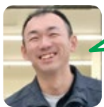
むらなか 大畑小・深川中大畑分校卒

A. something ELse 「ラストチャンス」 チャンスをもに出来 る気がする。 B. 5人