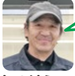
しのはら 阿川小・豊北第三中卒

A. エルトリカ「シマエ ナガの歌」今日も良 い日で終える事がで きるような気がします。 B. 5人