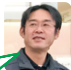
もとなが 向津貝小・向津貝中卒

A. 自動水栓。手をかざすだけで水が出るのでコロナ対策に持って来いです。 B. 波