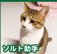
ソルト助手 愛嬌たっぷりの癒やし系な女の子。多少天然な所も。