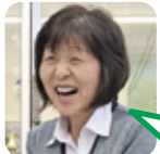
はらだ 誠意小・豊洋中卒

A. トイレのオート機能。子供がいても流し残りや閉め忘れもなく衛生的です。 B. 素潜り