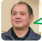
すえどみ 川尻小・油谷中卒

A. 自動水栓。手をかざすだけで水が出るのでコロナ対策に持って来いです。 B. 波