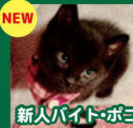
新人バイト・おぽ マイペースで甘えん坊な男の子。少し意地悪な所も。