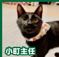
小町主任 誰にでも勇猛果敢に戦いを挑む強気な女の子。