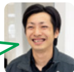
よこや 浅田小・三隅中卒

A. エコキュート。少ない電力で効率よくお湯が沸かせ経済的なところ。 B. 魚群