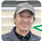
しのはら 阿川小・豊北第三中卒

A. ウォッシュレット(アプリコット)。水(お湯)の当たりが心地良いですよ。 B. 魚釣り、素潜り、バーベキュー