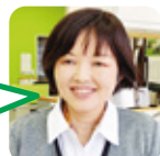
すぎうら 上郷小・小郡中卒

A. 肩からお湯が出るお風呂。(シンラ)心も体もポカポカでリラックスできます。 B. 角島(美味しい魚)