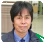
おきた 油谷小・菱海中卒

A. トイレのきれい除菌水。トイレが汚れにくく、お掃除がとっても楽になりました! B. 水平線