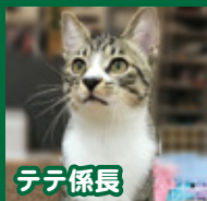
テテ係長 甘えん坊でくいしん坊な男の子。ソルトが大好き。