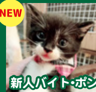
新人バイト・ポン 甘えん坊で暴れん坊、食欲旺盛、運動神経がいい男の子。