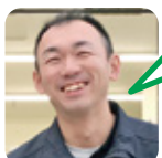
むらなか 大船小・深川中大船分校卒

A. キッチンのレンジフード。掃除の時の取り外しが簡単。外さずお湯で洗うタイプもあります。 B. 海水浴でバーベキュー