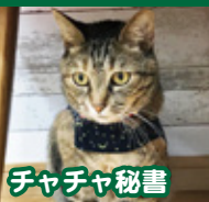
チャチャ秘書 負けん気が強い女の子。ソルト助手に強い対抗心が。